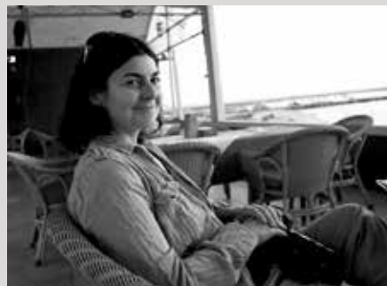
La photographe Anne Paq

Nous avons le plaisir d'offrir aux spectateurs du Festival, avant chaque film, un diaporama présentant des photos inédites réalisées à Gaza par la photographe Anne Paq, membre du groupe Activestills. ( http://www.activestills.org/ ).