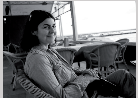
La photographe Anne Paq

Nous avons le plaisir d'offrir aux spectateurs du Festival, avant chaque film, un diaporama présentant des photos inédites réalisées à Gaza par la photographe Anne Paq, membre du groupe Activestills. ( http://www.activestills.org/ ).